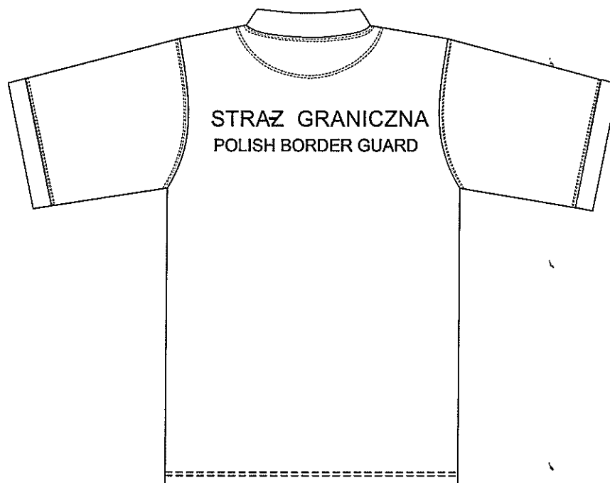
Rysunek 2. Tył podkoszulka koloru czarnego z krótkimi rękawami i napisem STRAŻ GRANICZNA POLISH BORDER GUARD

Opis Przedmiotu Zamówienia Podkoszulek koloru czarnego z krótkimi rękawami i napisem „STRAŻ GRANICZNA POLISH BORDER GUARD”