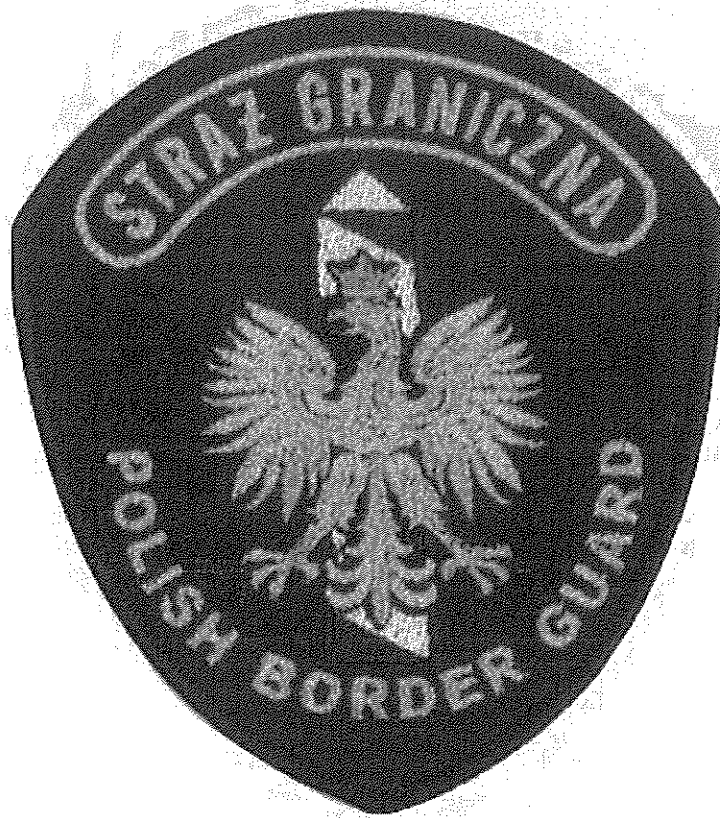
Rysunek 2. Emblemat „Straz Graniczna Polish Border Guard”