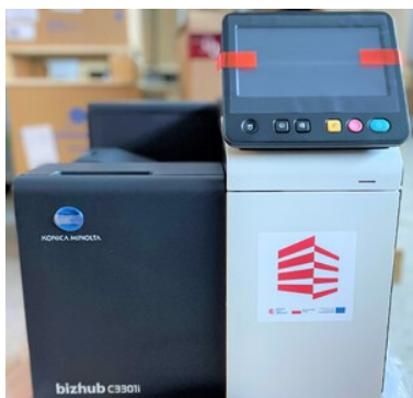
Zakupiony sprzęt do mobilnego punktu kontrolnego - drukarka