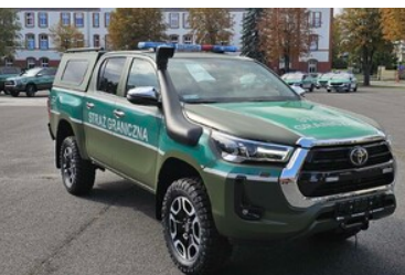
Zakupiony sprzęt do mobilnego punktu kontrolnego - pojazd terenowy typu pick-up