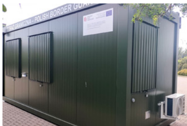
Zakupiony sprzęt do mobilnego punktu kontrolnego - mobilny kontener biurowy

przeszukiwania m.in. w celu zapobiegania nielegalnej migracji, przeciwdziałania nielegalnemu pobytowi na terytorium UE, przeciwdziałania terroryzmowi, itp.