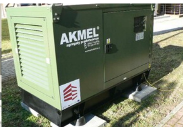
Zakupiony sprzęt do mobilnego punktu kontrolnego - agregat prądowórczy