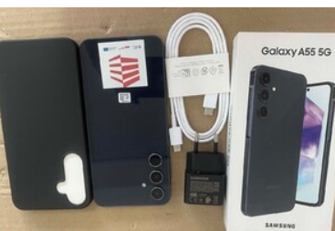
Zakupiony sprzęt do mobilnego punktu kontrolnego - telefon komórkowy