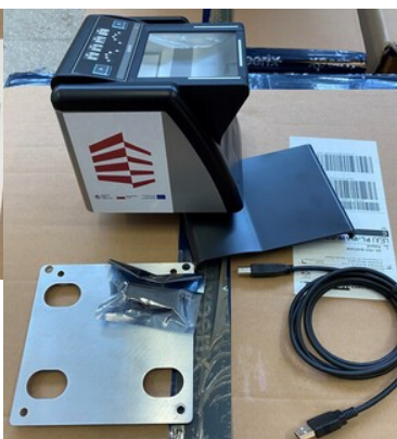
Zakupiony sprzęt do mobilnego punktu kontrolnego - urządzenie do pobierania odcisków palców