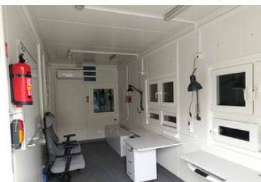
Zakupiony sprzęt do mobilnego punktu kontrolnego - mobilny kontener biurowy