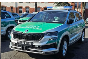
Zakupiony sprzęt do mobilnego punktu kontrolnego - pojazd osobowy