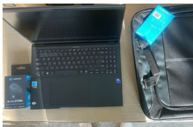
Zakupiony sprzęt do mobilnego punktu kontrolnego - komputer przenośny