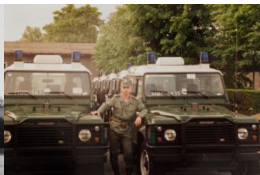
rok 1994 przyjęcie nowych pojazdów terenowych