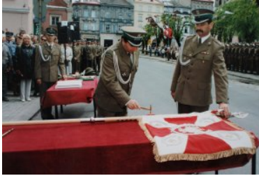
16.05.1999 roku nadanie sztandaru oraz patrona Bieszczadzkiemu Oddziałowi SG