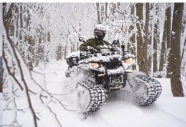
rok 2021 - Patrol zimą w Bieszczadach (quad na gąsienicach)