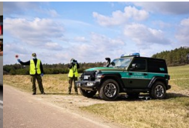
rok 2021 - patrol SG w terenie