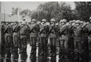
wrzesień 1992 r. Ślubowanie nowych funkcjonariuszy w komendzie BiOSG