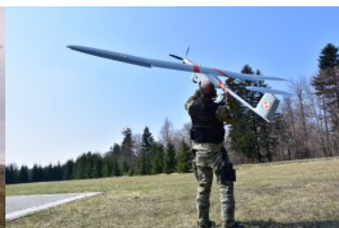
rok 2021 - wykorzystanie bezałogowych statków powietrznych w służbie na granicy