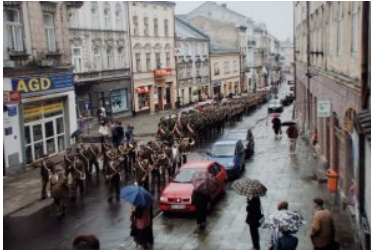
19.05.2001 r. Obchody 10. rocznicy powołania BiOSG