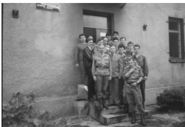
rok 1991 - funkcjonariusze Strażnicy SG w Medyce