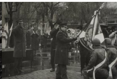
29.11.1992 r. Uroczystość wręczenia sztandaru funkcjonariuszom BiOSG