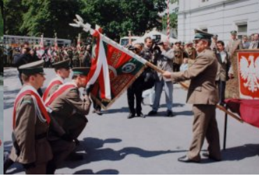
16.05.1999 roku nadanie sztandaru oraz patrona Bieszczadzkiemu Oddziałowi SG