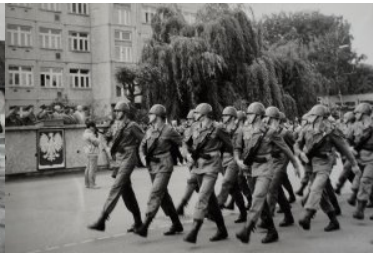
25 maja 1991 r. Pierwsze Ślubowanie nowych funkcjonariuszy w Bieszczadzki Oddziale SG