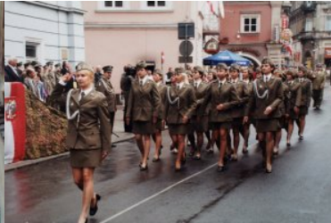
19.05.2001 r. Obchody 10. rocznicy powołania BiOSG