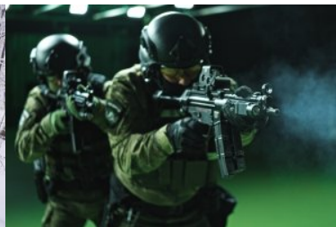
rok 2021 - szkolenie strzeleckie na strzelnicy pistoletowej w komendzie BiOSG w Przemyślu