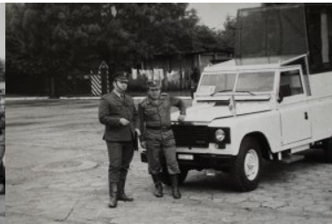
02.06.1991 r. Papamobile na terenie komendy BiOSG podczas wizyty papieża w Przemyślu