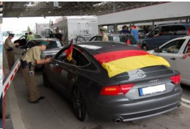
czerwiec 2012 roku - kontrola graniczna podczas EURO 2012