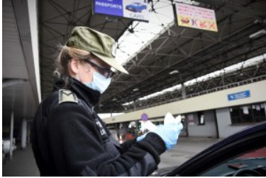
rok 2021 - kontrola graniczna podczas pandemii koronawirusa