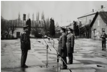
11 kwietnia 1991r. Uroczystość przemianowania Bieszczadzkiej Brygady WOP na Bieszczadzki Oddział SG