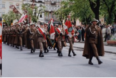
16.05.1999 roku nadanie sztandaru oraz patrona Bieszczadzkiemu Oddziałowi SG