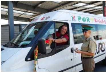
czerwiec 2012 roku - kontrola graniczna podczas EURO 2012