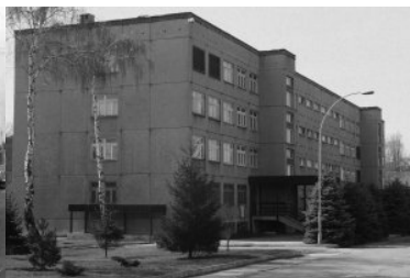
lata 90-te budynek tzw. koszarowca w komendzie BiOSG w Przemyślu