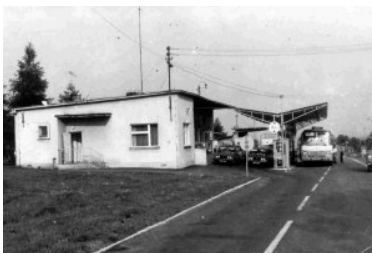
przejście graniczne w Medyce