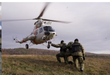
rok 2020 - wykorzystanie śmigłowca w służbie na granicy