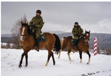
rok 2021 - patrol konny na granicy państwa