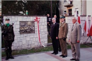
17.09.2003 r. Odświeżenie tablicy poświęconej żołnierzom KOP