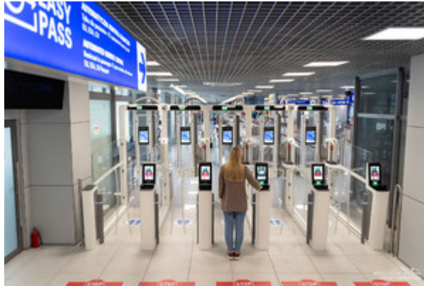
Lotnisko w Rzeszowie-Jasionce fot. ilustracyjna