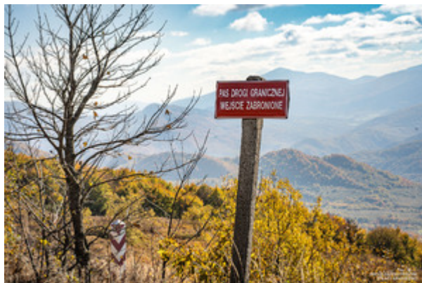
Znak pas drogi granicznej wejście zabronione