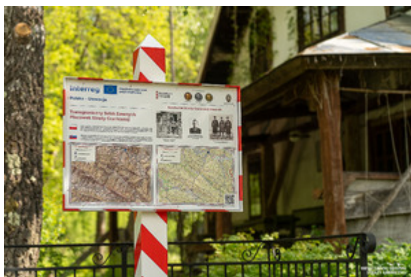
Transgraniczny Szlak Dawnych Placówek SG