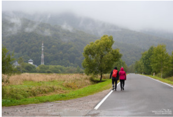
Turyści w Bieszczadach fot. ilustracyjna