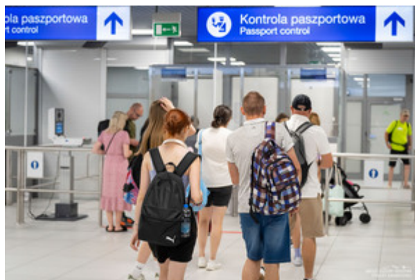
Lotnisko w Rzeszowie-Jasionce fot. ilustracyjna