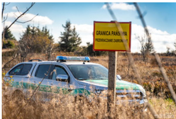
Znak granica państwa przekraczanie zabronione