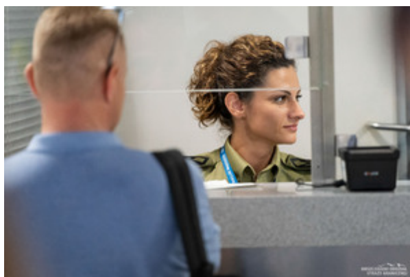
Kontrola na lotnisku w Rzeszowie-Jasionce