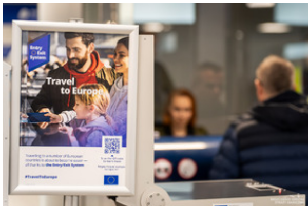
Kontrola graniczna fot. ilustracyjna