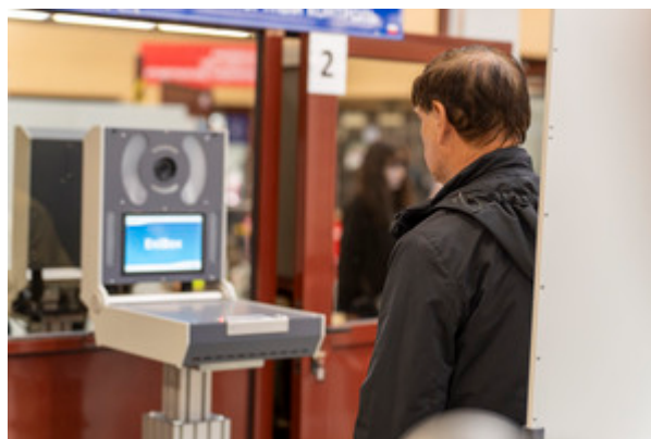
Kontrola graniczna fot. ilustracyjna

To kolejny tego typu przypadek wykryty z wykorzystaniem systemu Entry/Exit. Ostatnie tego typu zdarzenie odnotowano na początku maja, kiedy w ten sam sposób granicę usiłowało przekroczyć mołdawskie małżeństwo.