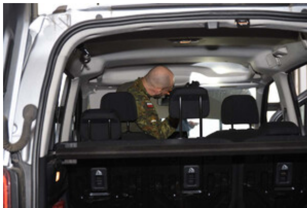
Ćwiczenia na przejściu granicznym w Korczowej