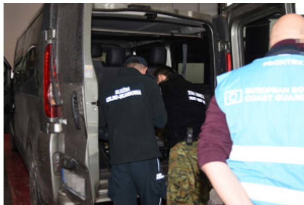
Ćwiczenia na przejściu granicznym w Korczowej

W ćwiczeniach uczestniczyli funkcjonariusze z placówki SG w Korczowej oraz mundurowi z KAS.