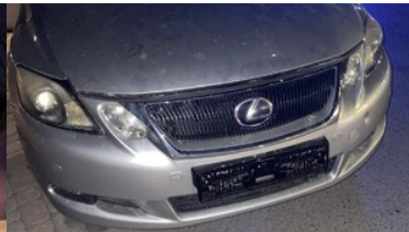
zdjęcia z interwencji