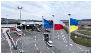
Przejście graniczne Malhowice-Nizankowice. Flagi Polski, Unii Europejskiej oraz Ukrainy

Główne kierunki działań związane będą z zapewnieniem skutecznej kontroli granicznej, ochrony nienaruszalności granicy państwowej na tzw. granicy zielonej oraz walka z zorganizowaną przestępczością (szczególnie w zakresie nielegalnej migracji). Na Podkarpaciu prowadzone będą zintensyfikowane działania w zakresie legalności pobytu i zatrudnienia cudzoziemców.