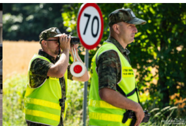
Funkcjonariusze Straży Granicznej podczas kontroli drogowej