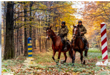
Funkcjonariusze Straży Granicznej podczas patrolu konnego przy znakach granicznych