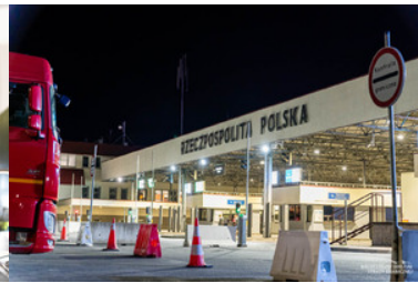
Przejście graniczne w Korczowej, ciężarówka oraz napis Rzeczpospolita Polska