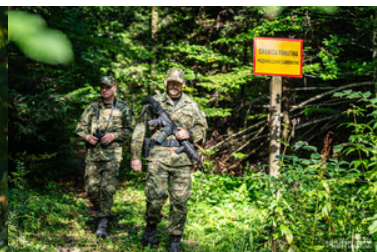
Patrol Straży Granicznej podczas patrolu pieszego