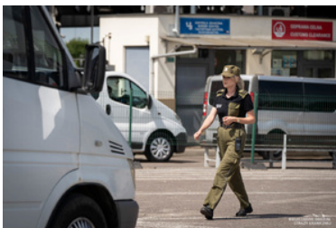
funkcjonariuszka Straży Granicznej idzie w kierunku pojazdów na przejściu granicznym w Medyce