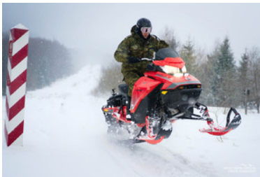
Funkcjonariusz Straży Granicznej na skuterze śnieżnym obok znaku granicznego