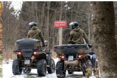
Funkcjonariusze Straży Granicznej na quadach obok znaku PAS DROGI GRANICZNEJ WEJŚCIE ZABRONIONE