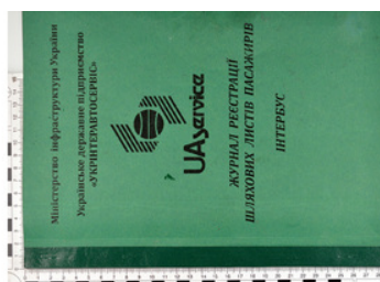
Ujawnione przerobione dokumenty komunikacyjne