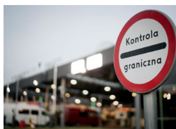
PSG w Medyce

Od początku 2024 roku strażnicy graniczni z Podkarpacia wykryli już podczas kontroli granicznej 35 przerobionych książek Interbus oraz ponad 80 fałszywych praw jazdy.