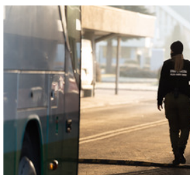
przejście graniczne w Korczowej. Funkcjonariuszka Straży Granicznej stoi przy autobusie

Od początku 2024 roku strażnicy graniczni z Podkarpacia wykryli już ponad 20 cudzoziemców, którzy zmienili swoje dane osobowe, aby uniknąć konsekwencji prawnych, popełnionych wcześniej czynów. Byli to głównie obywatele Ukrainy oraz trzech Mołdawian i dwóch Gruzinów.