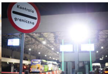
znak kontrola graniczna na przejściu granicznym w Korczowej