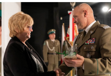
uroczysta zbiórka w przemyskim muzeum w związku z otwarciem wystawy