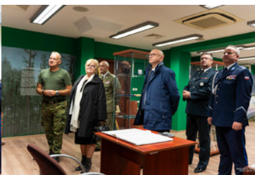
wizyta wojewody podkarpackiej w komendzie BiOSG