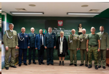
wizyta wojewody podkarpackiej w komendzie BiOSG