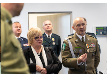
wizyta wojewody podkarpackiej w komendzie BiOSG