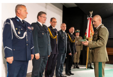
uroczysta zbiórka w przemyskim muzeum w związku z otwarciem wystawy