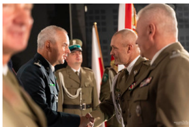
uroczysta zbiórka w przemyskim muzeum w związku z otwarciem wystawy