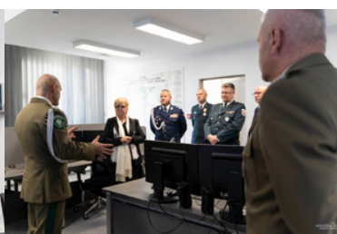
wizyta wojewody podkarpackiej w komendzie BiOSG