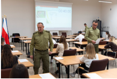
II etap postępowania kwalifikacyjnego do służby w BiOSG (test pisemny)