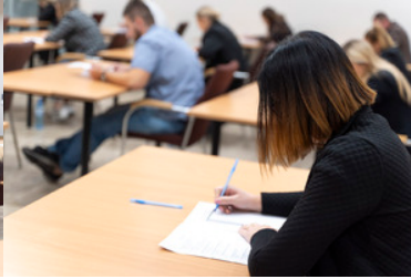
II etap postępowania kwalifikacyjnego do służby w BiOSG (test pisemny)