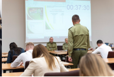
II etap postępowania kwalifikacyjnego do służby w BiOSG (test pisemny)