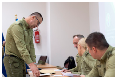
II etap postępowania kwalifikacyjnego do służby w BiOSG (test pisemny)

Więcej informacji na temat naboru dostępne jest na stronie BiOSG w zakładce rekrutacja do służby ( link <<rekrutacja do służby>> )