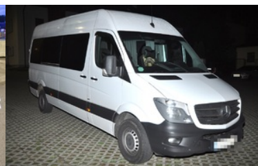
mercedes z podejrzają skrzynią biegów