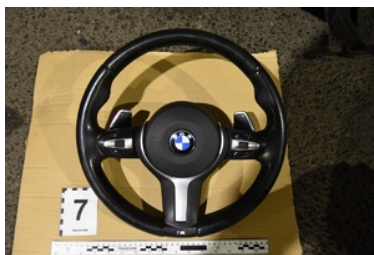
części pochodzące ze skradzionego bmw

Do podobnego zdarzenia doszło na tym samym przejściu granicznym dzień wcześniej (12.10). Do odprawy na wyjazd z Polski zgłosił się 48-letni Rumun. Mężczyzna podróżował busem marki Mercedes-Benz Sprinter. Podczas szczegółowej kontroli pojazdu stwierdzono nieścisłości w oznaczeniach skrzyni biegów. Najprawdopodobniej w celu uniemożliwienia identyfikacji, większość z nich została usunięta. Pojazd o szacunkowej wartości 110 tys. złotych został zatrzymany i zostanie poddany szczegółowej ekspertyzie przez ekspertów kryminalistyki z BiOSG.