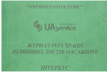
ujawniona fałszywa książka Interbus