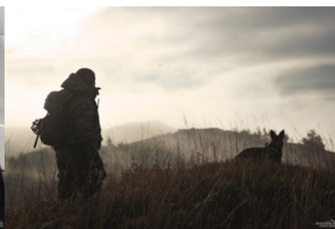
Funkcjonariusz SG z psem służbowym