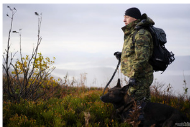
Funkcjonariusz SG z psem służbowym

Wszystkim czteronożnym funkcjonariuszom życzymy jak najwięcej powodów do merdania ogonem! ;)