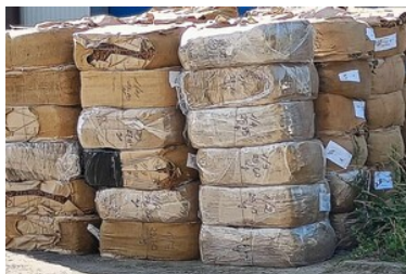
zdjęcia z realizacji sprawy