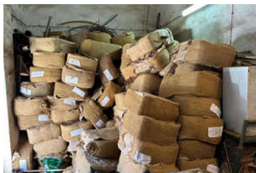
zdjęcia z realizacji sprawy