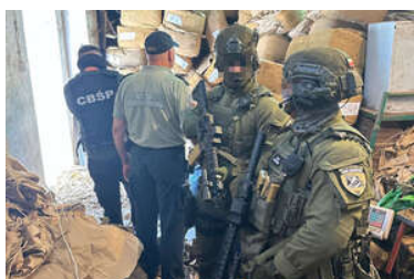
zdjęcia z realizacji sprawy