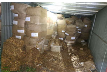
zdjęcia z realizacji sprawy