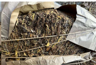
zdjęcia z realizacji sprawy