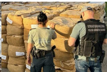
zdjęcia z realizacji sprawy