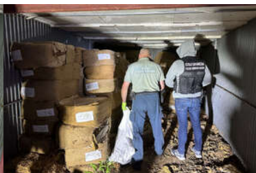
zdjęcia z realizacji sprawy