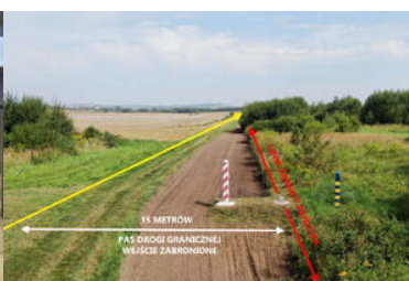
poradnik wakacyjny SG