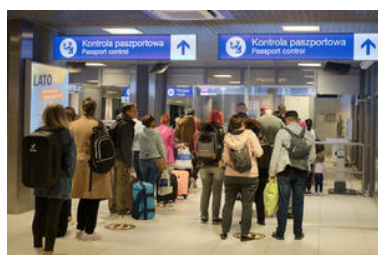
poradnik wakacyjny SG