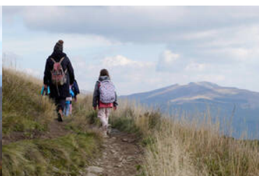
poradnik wakacyjny SG