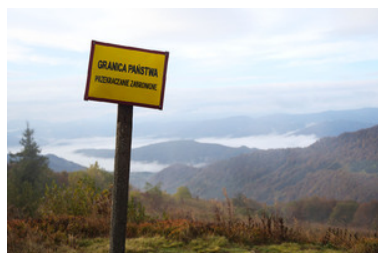
poradnik wakacyjny SG