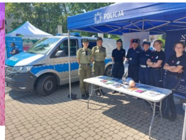
stoisko Policji oraz funkcjonariusze