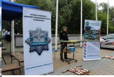
stoisko SG oraz funkcjonariusz