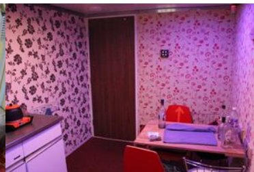
pomieszczenie w pojeździe ewakuacyjnym