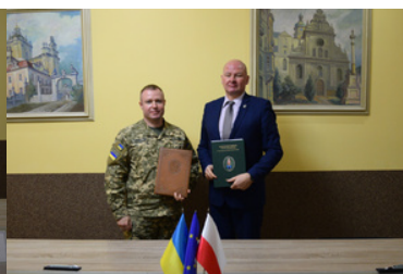
Spotkanie pełnomocników granicznych Polski i Ukrainy