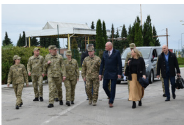
Spotkanie pełnomocników granicznych Polski i Ukrainy

Spotkanie było również okazją do omówienia aktualnych zagadnień oraz wyznaczenia głównych obszarów dalszej współpracy. Na zakończenie spotkania delegacje podpisały protokoły podsumowujące poruszone kwestie.