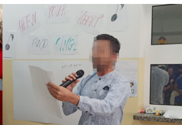
Strzeżony Ośrodek dla Cudzoziemców w Przemyślu - konkurs piosenki (czerwiec 2023)