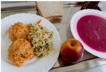
Strzeżony Ośrodek dla Cudzoziemców w Przemysłu - obiad wegański (20.07.2023r.)