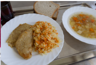
Strzeżony Ośrodek dla Cudzoziemców w Przemysłu - obiad wegański (21.07.2023r.)