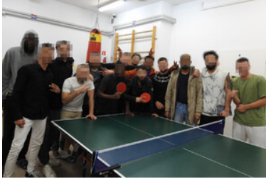
Strzeżony Ośrodek dla Cudzoziemców w Przemysłu - turniej tenisa stołowego (kwiecień 2023)