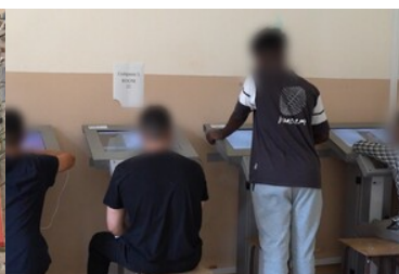
Strzeżony Ośrodek dla Cudzoziemców w Przemyślu - sala komputerowa