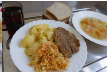
Strzeżony Ośrodek dla Cudzoziemców w Przemysłu - obiad standardowy (21.07.2023r.)