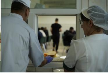
Strzeżony Ośrodek dla Cudzoziemców w Przemysłu - wydawanie posiłków