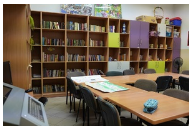
Strzeżony Ośrodek dla Cudzoziemców w Przemyślu - biblioteka