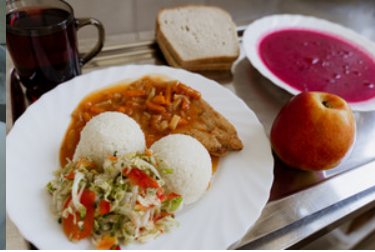
Strzeżony Ośrodek dla Cudzoziemców w Przemysłu - obiad standardowy (20.07.2023r.)