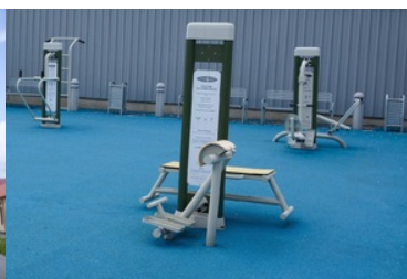
Strzeżony Ośrodek dla Cudzoziemców w Przemyślu - siłownia zewnętrzna