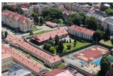
Strzeżony Ośrodek dla Cudzoziemców w Przemyślu

Koszty utrzymania ośrodka i cudzoziemców (w tym głównie: media, usługi, remonty, wyżywienie, leczenie, zakup wyposażenia, odzieży oraz środków higieny) sfinansowane z budżetu państwa oraz funduszy unijnych w 2022 roku wyniosły ponad 2,8 mln złotych, z kolei w 2023 roku do końca maja było to ponad 1,3 mln złotych. Wskazane koszty nie uwzględniają uposażenia funkcjonariuszy oraz pracowników ośrodka.