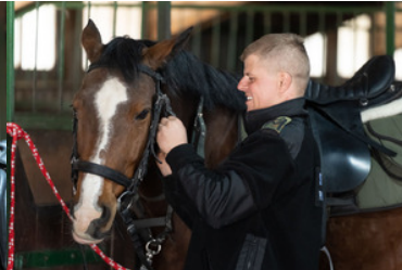
Konie w Bieszczadzkiem Oddziale Straży Granicznej