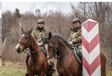
Konie w Bieszczadzkiem Oddziale Straży Granicznej