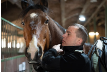
Konie w Bieszczadzkiem Oddziale Straży Granicznej