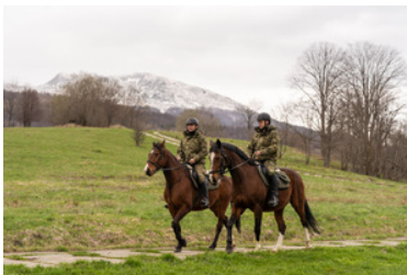
Konie w Bieszczadzkiem Oddziale Straży Granicznej