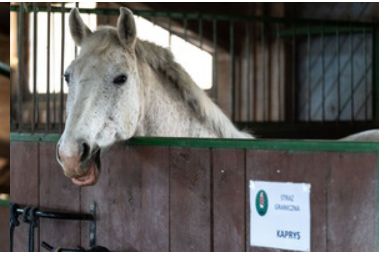
Konie w Bieszczadzkiem Oddziale Straży Granicznej