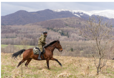
Konie w Bieszczadzkiem Oddziale Straży Granicznej