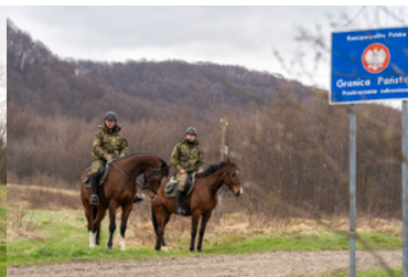
Konie w Bieszczadzkiem Oddziale Straży Granicznej