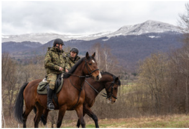
Konie w Bieszczadzkiem Oddziale Straży Granicznej