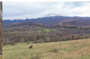
Konie w Bieszczadzkiem Oddziale Straży Granicznej