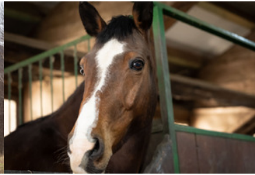
Konie w Bieszczadzkiem Oddziale Straży Granicznej