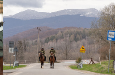
Konie w Bieszczadzkiem Oddziale Straży Granicznej