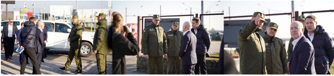
Sekretarz Bezpieczeństwa Wewnętrznego USA z wizytą na polsko-ukraińskiej granicy

Graniczną. Zaznaczył, że spotkał się z dowództwem Straży Granicznej na Podkarpaciu po to, by pokazać solidarność, ale także wyrazić podziw.