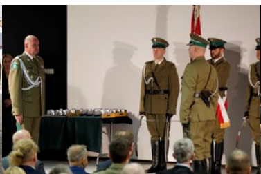
Święto patrona Bieszczadzkiego Oddziału SG