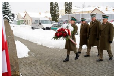
Święto patrona Bieszczadzkiego Oddziału SG