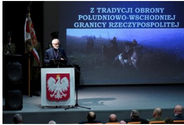
Święto patrona Bieszczadzkiego Oddziału SG