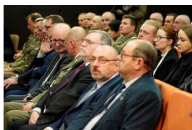
Święto patrona Bieszczadzkiego Oddziału SG