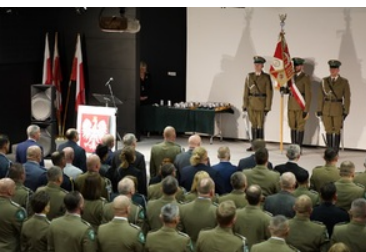
Święto patrona Bieszczadzkiego Oddziału SG