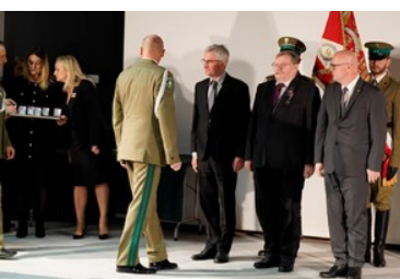
Święto patrona Bieszczadzkiego Oddziału SG