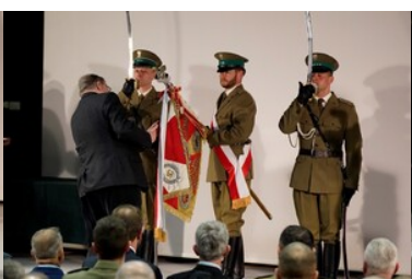
Święto patrona Bieszczadzkiego Oddziału SG