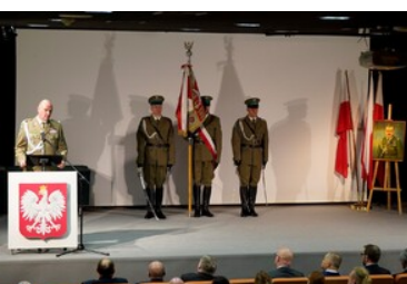
Święto patrona Bieszczadzkiego Oddziału SG