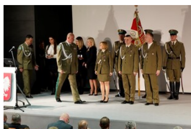
Święto patrona Bieszczadzkiego Oddziału SG