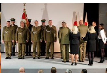
Święto patrona Bieszczadzkiego Oddziału SG