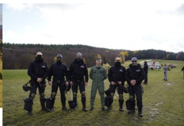
ćwiczenia z grywające służby