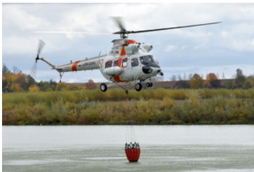
ćwiczenia z grywające służby