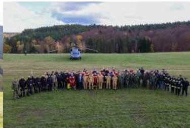
ćwiczenia z grywające służby