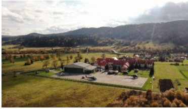
ćwiczenia z grywające służby

Podkreślił wagę praktycznego przećwiczenia działań mogących w przyszłości ratować ludzkie życie i zdrowie.