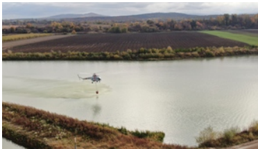
ćwiczenia z grywające służby