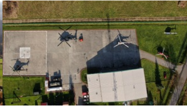
ćwiczenia z grywające służby