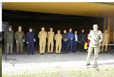
ćwiczenia z grywające służby