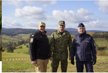
ćwiczenia z grywające służby