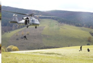
ćwiczenia z grywające służby