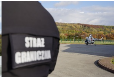
ćwiczenia z grywające służby