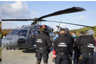
ćwiczenia z grywające służby