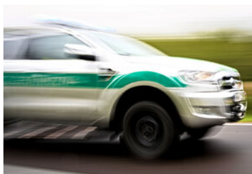
pojazd SG w pościgu

Do podobnego zdarzenia doszło dzień później w rejonie ochraniającym przez strażników granicznych z placówki w Stuposianach. Mundurowi postanowili zatrzymać do kontroli volvo na polskich numerach rejestracyjnych. Kierowcą pojazdu był 45-letni mieszkaniec Podkarpacia, który został zatrzymany po krótkim pościgu. Jak się okazało, był pod wpływem alkoholu. W wydechanym powietrzu miał prawie 3 promile alkoholu.