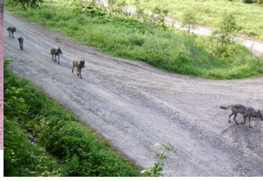
zwierzęta zaobserwowane na granicy