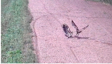
zwierzęta zaobserwowane na granicy