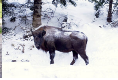
zwierzęta zaobserwowane na granicy