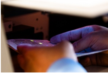
kontrola dokumentów na granicy państwa