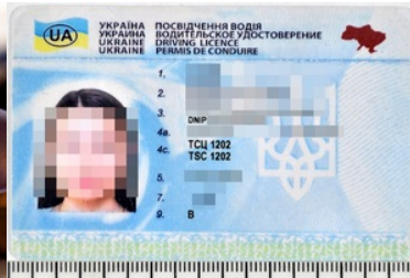
ujawnione fałszywe prawo jazdy