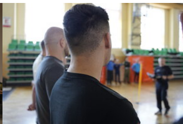
Egzaminy dla kandydatów do służby w SG