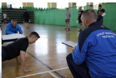
Egzaminy dla kandydatów do służby w SG