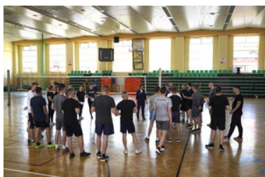
Egzaminy dla kandydatów do służby w SG