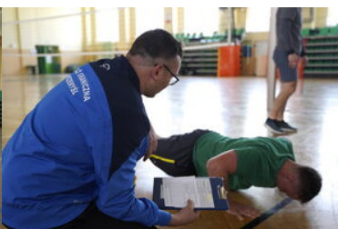
Egzaminy dla kandydatów do służby w SG