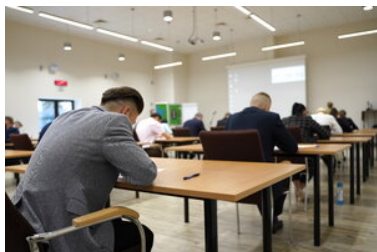
Egzaminy dla kandydatów do służby w SG

Służba w Bieszczadzkiem Oddziale SG cieszy się dużym zainteresowaniem, czego dowodem jest liczba składanych podań o przyjęcie. Nabór do BiOSG prowadzony jest w sposób ciągły. Łącznie w 2022 roku zaplanowano wcielenie 70 nowych funkcjonariuszy. Najbliższe przyjęcia będą w czerwcu (25 osób), kolejni adepti zostaną przyjęci w październiku. Wszystkie niezbędne informacje oraz wzory dokumentów dostępne są na stronie internetowej w zakładce Nabór .