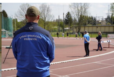
Egzaminy dla kandydatów do służby w SG