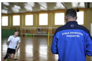
Egzaminy dla kandydatów do służby w SG