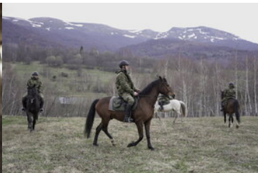
Konie w Bieszczadzkiem Oddziale Straży Granicznej