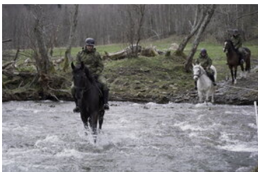
Konie w Bieszczadzkiem Oddziale Straży Granicznej