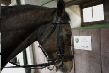
Konie w Bieszczadzkiem Oddziale Straży Granicznej