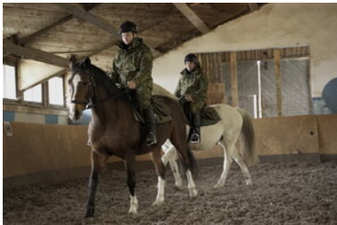
Konie w Bieszczadzkiem Oddziale Straży Granicznej