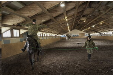
Konie w Bieszczadzkiem Oddziale Straży Granicznej