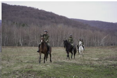
Konie w Bieszczadzkiem Oddziale Straży Granicznej