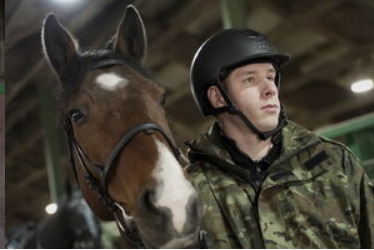
Konie w Bieszczadzkiem Oddziale Straży Granicznej