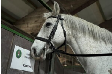
Konie w Bieszczadzkiem Oddziale Straży Granicznej

Naszym czworonożnym kompanom życzymy, aby zawsze miały pełne żłoby, ciepłą stajnię, wiatr w grzywie oraz oddanych jeźdźców!