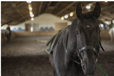
Konie w Bieszczadzkiem Oddziale Straży Granicznej