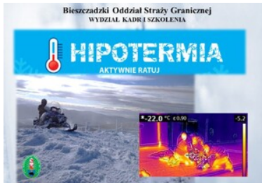
webinarium z zakresu pomocy osobom w stanie hipotermii

W związku z dużym zainteresowaniem funkcjonariuszy, planowane są kolejne edycje szkolenia.