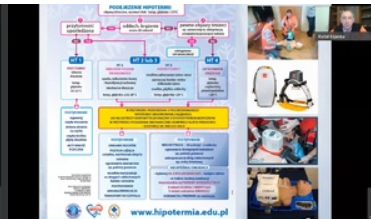
webinarium z zakresu pomocy osobom w stanie hipotermii