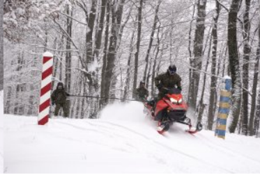
wiosenny partrol w zimowej aurze w Bieszczadach