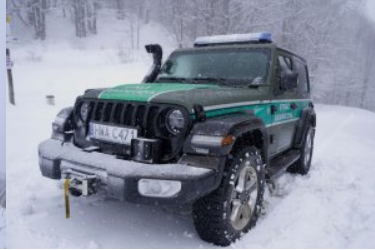
wiosenny partrol w zimowej aurze w Bieszczadach