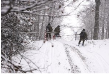
wiosenny partrol w zimowej aurze w Bieszczadach