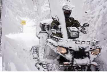
wiosenny partrol w zimowej aurze w Bieszczadach