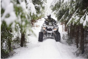
wiosenny partrol w zimowej aurze w Bieszczadach