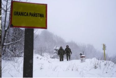
wiosenny partrol w zimowej aurze w Bieszczadach