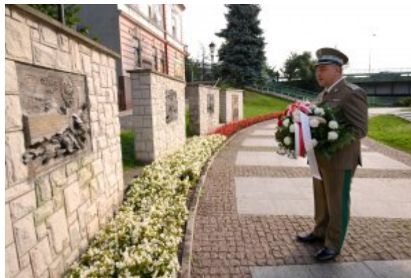
gen. bryg. SG Robert Rogoz przy pamiątkowej tablicy KOP

Dzisiaj funkcjonariusze współczesnej Straży Granicznej z dumą niosą testament i przywołują etos swych poprzedników z okresu dwudziestolecia międzywojennego, doceniając ich wkład w niepodległość Rzeczypospolitej.