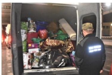
motocykle ukryte pomiędzy bagażami

W bieżącym roku funkcjonariusze Bieszczadzkiego Oddziału Straży Granicznej zatrzymali już ponad 80 skradzionych pojazdów różnego typu ( w tym m.in. pojazdy osobowe, ciężarowe, motocykle, quady) wartych łącznie przeszło 4,3 mln złotych.