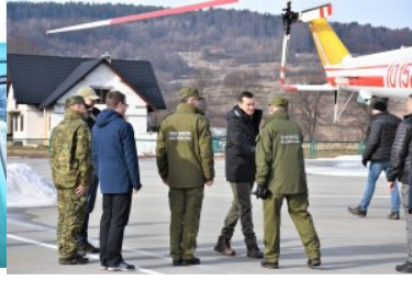
Wizyta w PSG w Huwnikach