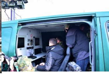
Prezentacja pojazdu obserwacyjnego SG