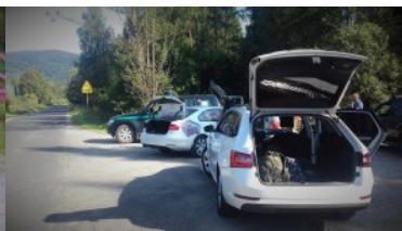
Skoda wykorzystana do przerzutu imigrantów