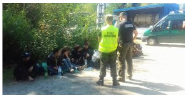
zatrzymani imigranci z Wietnamu

więcej osób), w 9 przypadkach strażnicy graniczni zatrzymali również organizatorów przerzutu.