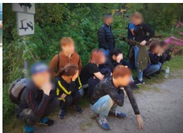
zatrzymani imigranci z Wietnamu