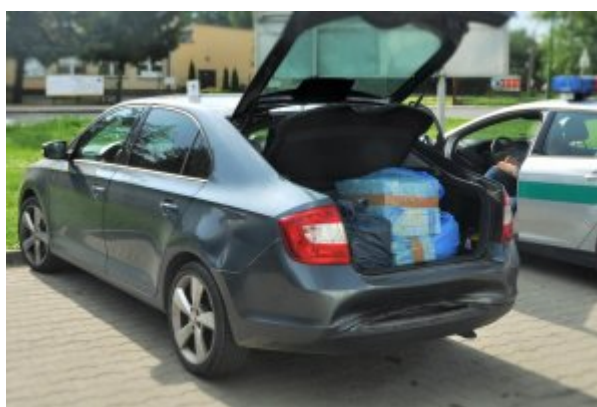
nielegalne papierosy ujawnione podczas kontroli drogowej

Wyniki kontroli przestrzeni pojazdu potwierdziły trafną intuicję funkcjonariuszy. W pojeździe ujawnili prawie 3,5 paczek papierosów bez polskich znaków skarbowych o wartości około 50 tys. złotych. Strażnicy graniczni zabezpieczyli towar oraz przedstawili ob. Polski zarzuty popełnienia przestępstwa skarbowego.