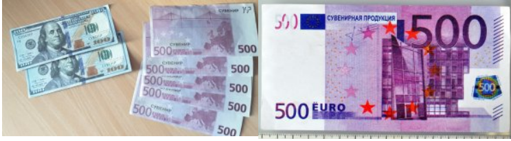
banknoty do gier planszowych