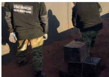
Kontrabanda w rudzie żelaza

Od początku tego roku odnotowano już 14 zdarzeń, kiedy w pociągach towarowych próbowano przemyścić papierosy bez polskich skarbowych znaków akcyzy – łącznie zabezpieczono 37 tys. paczek papierosów o wartości ok.500 tys. zł. W tym, 6 - krotnie próbowano przemyścić kontrabandę ukrytą w rudzie żelaza – 27 tys. paczek papierosów o łącznej wartości 365 tys. zł.