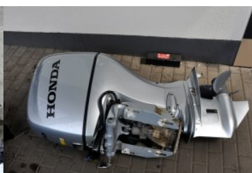
Funkcjonariusze SG z Medyki ujawnili dwa skradzione silniki zaburtowe