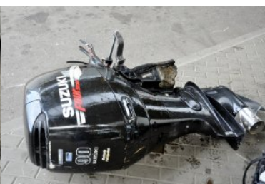
Funkcjonariusze SG z Medyki ujawnili dwa skradzione silniki zaburtowe