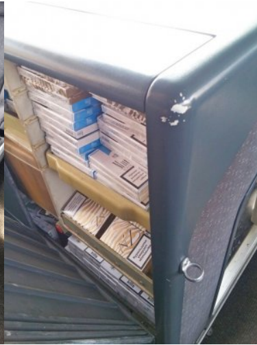
Papierosy ukryte były w minibarku znajdującym się w autokarze