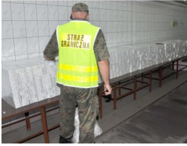
Funkcjonariusze z PSG w Korczowej papierosy z przemytu znaleźli w starej skrzyni na strychu domu