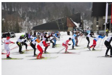
III Bieg Tropem Żubra - Muczne 2017

W „Biegu Tropem Żubra” wzięło w tym roku udział łącznie 91 osób. Bieszczadzki Oddział Straży Granicznej był jednym z współorganizatorów tej sportowej imprezy.