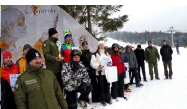
Mistrzostwa BiOSG w Narciarstwie Zjazdowym Ustrzyki Dolne - Laworta 2017