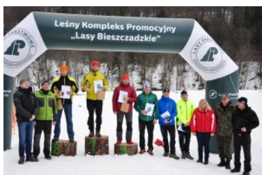
III Bieg Tropem Żubra - Muczne 2017