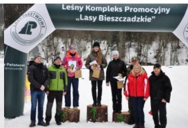
III Bieg Tropem Żubra - Muczne 2017