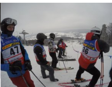
Mistrzostwa BiOSG w Narciarstwie Zjazdowym