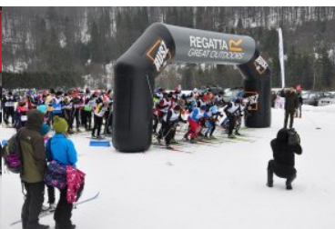
III Bieg Tropem Żubra - Muczne 2017