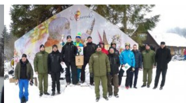
Mistrzostwa BiOSG w Narciarstwie Zjazdowym Ustrzyki Dolne - Laworta 2017