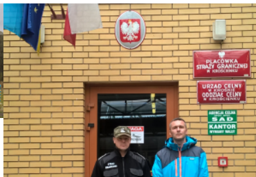
Przedstawiciel Policji Republiki Serbskiej z wizytą w PSG w Krościenku