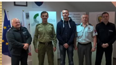
Przedstawiciel Policji Republiki Serbskiej z wizytą w Centrum Współpracy Policyjnej i Celnej w Barwinku