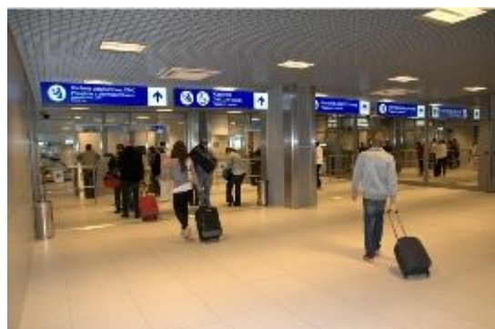
Kontrola graniczna - przyloty