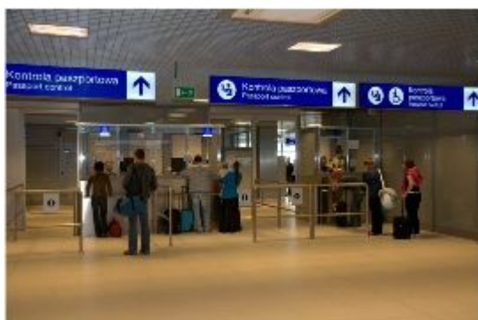
Kontrola graniczna - odloty