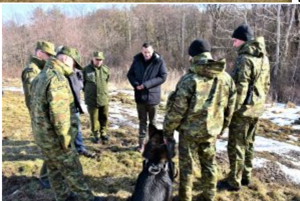
Spotkanie z patrolem SG