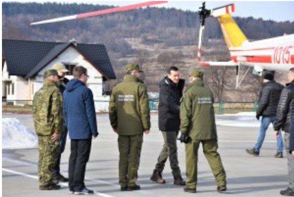
Wizyta w PSG w Huwnikach