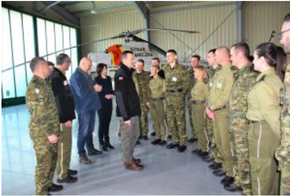
Spotkanie Premiera i Ministrów z funkcjonariuszami BiOSG