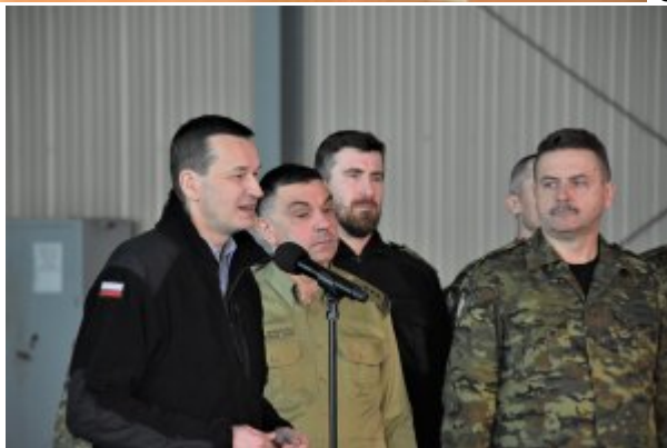
Spotkanie Premiera i Ministrów z funkcjonariuszami BiOSG