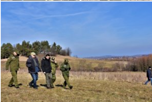
Wizyta na "zielonej granicy"