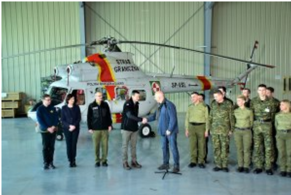
Spotkanie Premiera i Ministrów z funkcjonariuszami BiOSG