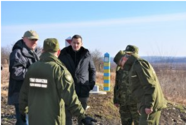
Wizyta na "zielonej granicy"