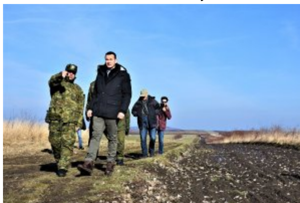
Wizyta na "zielonej granicy"