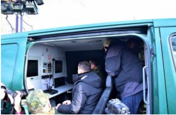
Prezentacja pojazdu obserwacyjnego SG