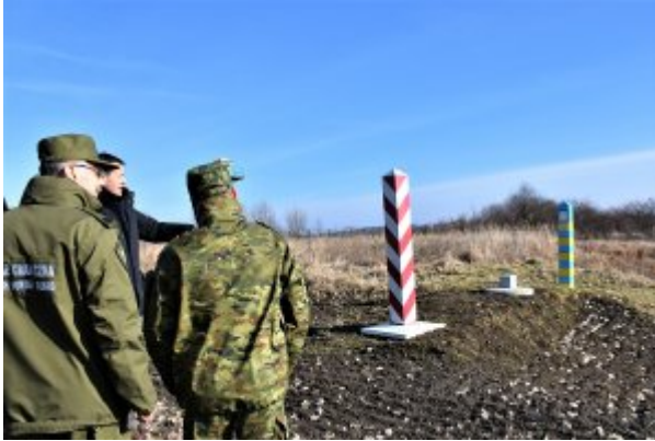
Wizyta na "zielonej granicy"