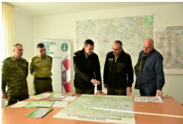
Odprawa z kadrą kierowniczą BiOSG

W ostatniej części wizyty delegacja udała się na odcinek tzw. zielonej granicy. Premier oraz Ministrowie spotkali się m.in. z funkcjonariuszami pełniącymi służbę w formie patrolu z psem służbowym. Odwiedzono także punkt obserwacyjny w Kalwarii Paclawskiej, gdzie zaprezentowano pojazd obserwacyjny wyposażony w kamerę termowizyjną, wykorzystywany do zabezpieczenia granicy w porze dziennej oraz nocnej.