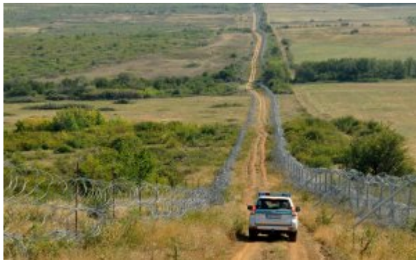
patrol na granicy macedońskiej-greckiej