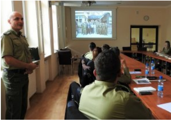
Odprawa w komendzie BiOSG